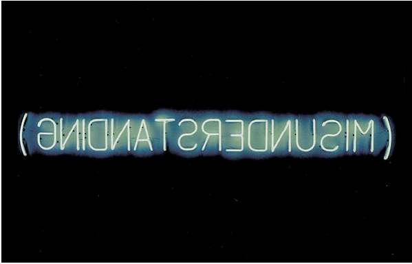
STEFAN BRÜGGEMANN, (Misunderstanding) 2005, white neon & black, edition of 3