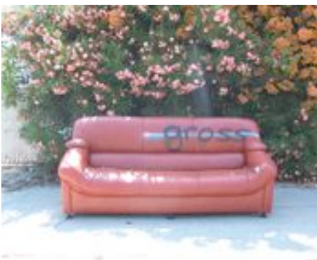
PRVTDNCR, Gross 2006, 50 x 75 cm, color photographs, Edition of 10