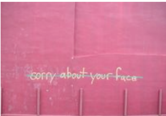
PRVTDNCR, Sorry About Your Face 2006, 50 x 75 cm, color photographs, Edition of 10